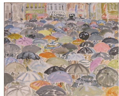
Abb.: Versammlung im Regen, 1983, Pb

Im Disteli-Kabinett zeigen wir bis am 13. März 2011 weiterhin: Von Bild zu Bild – Martin Disteli erzählt Geschichten