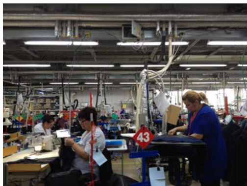
Roland Roos (*1974) Innenpolstererei, Pirin-TEX, Goze Deltsew (BG), 2017 Fotografie Kunstmuseum Olten

«Das Leben ist kein Ponyhof!» nimmt den 100. Jahrestag des Schweizerischen Landesstreiks, der vom «Oltner Aktionskomitee» organisiert und koordiniert wurde, zum Anlass für ein Ausstellungsprojekt, das sich mit der Arbeit und dem Arbeiten auseinandersetzt. Unter dem bezeichnenden Titel präsentieren wir Werke von Kunstschaffenden, welche die Bedeutungen, Gesetzmässigkeiten und Rahmenbedingungen dieses zentralen Bereichs unseres Lebens thematisieren und hinterfragen.