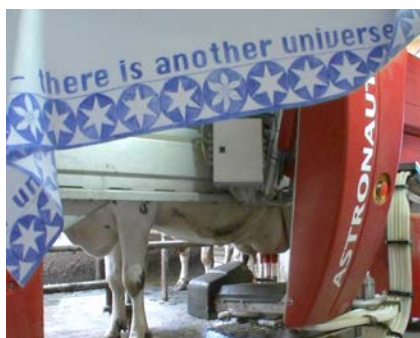
Copa & Sordes (Birgit Krueger *1967, Eric Schmutz *1962) Astronaut – der Melkroboter, Wyler, Seedorf (BE), 2009 Videotableau, HDV, 60 min © Copa & Sordes

Kunstmuseum Olten Kirchgasse 8, CH-4600 Olten, +41 62 212 86 76, info@kunstmuseumolten.ch Di–Fr 14–17 Uhr (Do bis 19 Uhr), Sa/So 10–17 Uhr; weitere Informationen: www.kunstmuseumolten.ch