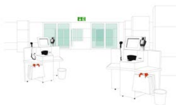
Joëlle Flumet (*1971) I would prefer not to 2.0 (Self-checking), 2017 Inkjet-Druck auf Aluminium, 70 x 100 cm