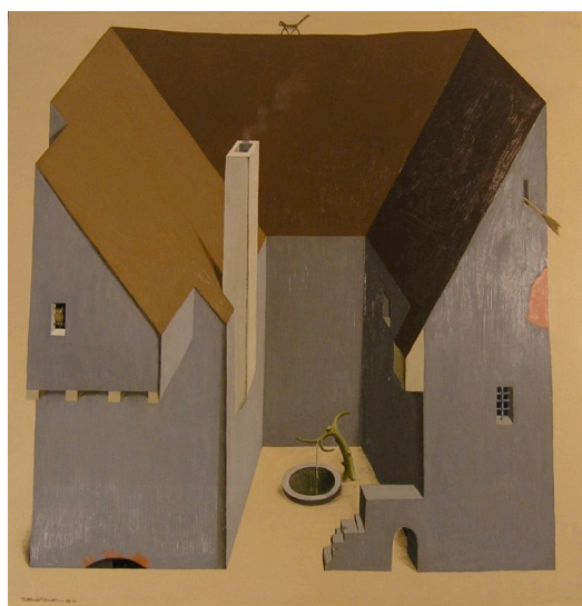
Niklaus Stoecklin (1896–1982) Das Geisterhaus, 1929/30 Öl auf Holz, 105 x 113 cm Kunstmuseum Olten, Inv. 2005.1

Weiteres Pressematerial: www.kunstmuseumolten.ch unter der Rubrik «Medien»